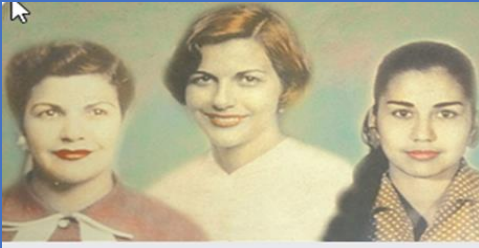
À l'origine du 25 novembre, journée internationale contre les violences faites aux femmes, l'assassinat des sœurs Mirabal en République dominicaine - 50 - 50 Magazine 50-50magazine.fr

Patria Mercedes, María Argentina Minerva, Antonia María Teresa, trois sœurs engagées dans le mouvement clandestin de lutte contre la dictature de Rafaël Trujillo.